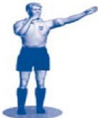
Tiro libre directo