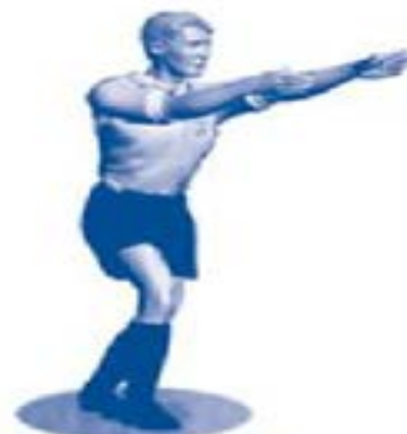
Aplicación de la ventaja