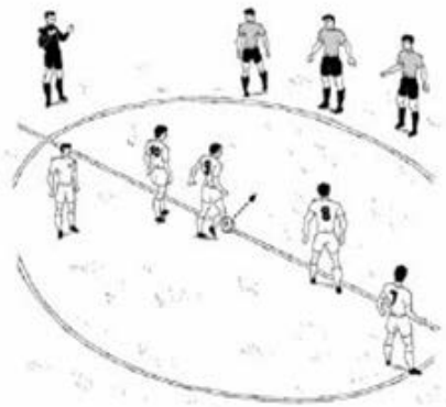
Saque BIEN ejecutado