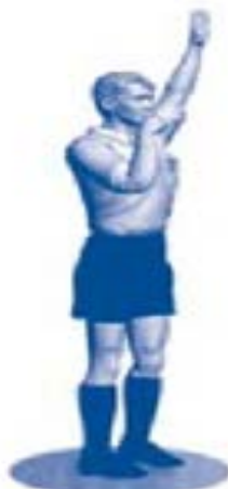
Tiro libre indirecto