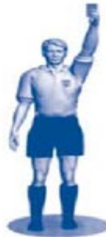
Tarjeta roja (Expulsión)