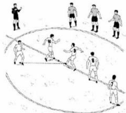
Saque MAL ejecutado