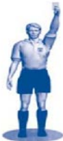
Tarjeta amarilla (Amonestación)